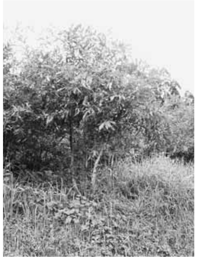
写真- 2. 国内産クヌギ萌芽木