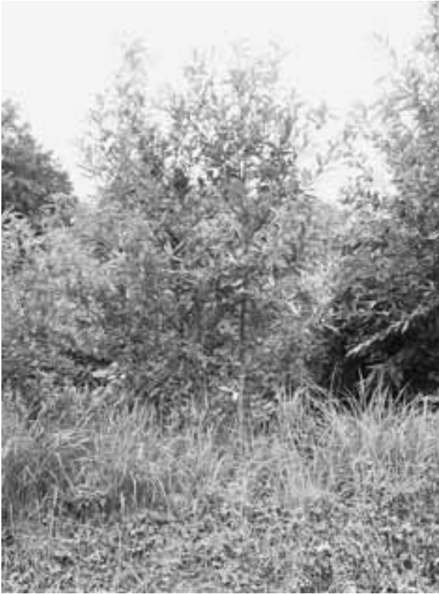
写真- 1. 中国産クヌギ萌芽木