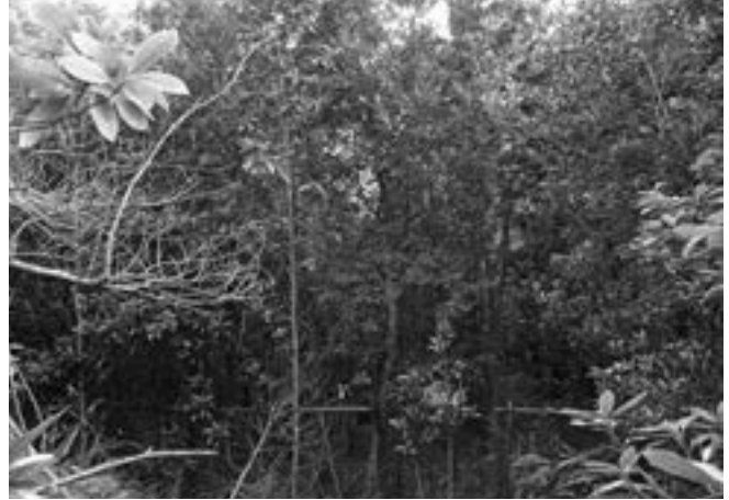
写真-1. 植栽地のギャップ区の様子。2005年（左）と2012年（右）。